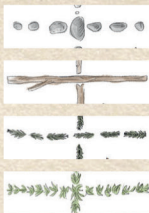
Die vier Sets

Jeder Spieler nimmt sich die 5 Puzzlekarten eines Sets . Diese zeigen auf ihren Vorder- und Rückseiten unterschiedliche Anordnungen von 4 Blättern. Die Sets sind an den Trennlinien zwischen den Blättern zu unterscheiden (Stein, Stock, Moos, Tannenzweig).